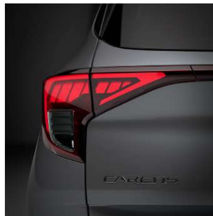
> Luces traseras tipo LED