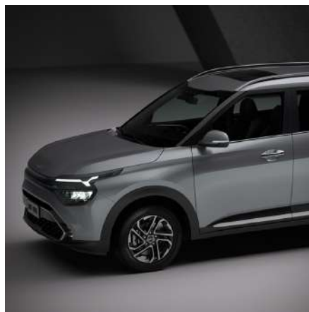
> Rieles de techo