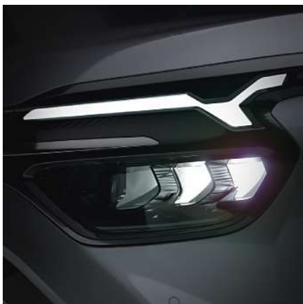
> Luces delanteras LED