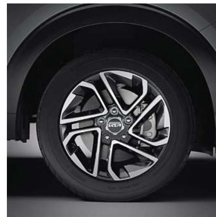
> Rines de aleación de 16"